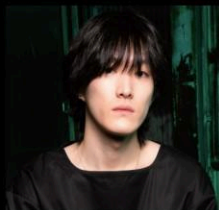
元超高校級天才プロゲーマー ゆきお