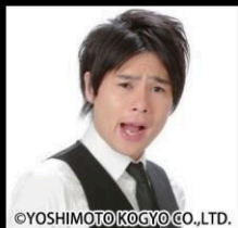
お笑い界の名バイプレイヤー 平成ノブシコプシ 吉村崇