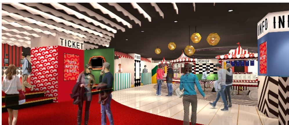
※『東京ミステリーサーカス』1階内観メージ

同じく 1 階では、「東京ミステリーサーカス」オリジナルのグッズや、公演中のイベントグッズ、東京ミステリーサーカスでしか出会えない様々な謎付きグッズなどを扱う「TMC GOODS SHOP」を営業いたします。来場の記念にも最適な「謎付きのお土産」など限定アイテムが登場する予定です。