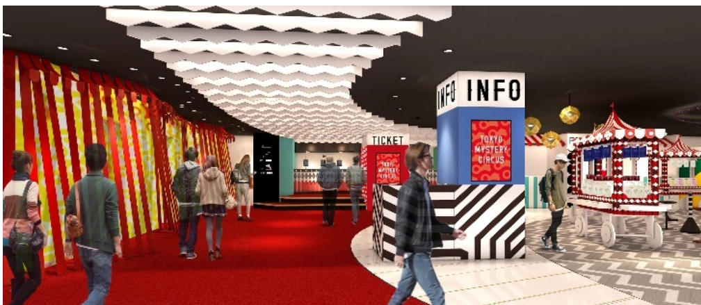
※『東京ミステリーサーカス』1階内観イメージ

リアル脱出ゲームを展開する株式会社 SCRAP（所在地：東京都渋谷区、代表者：加藤隆生、以下：SCRAP）、株式会社イープラス（所在地：東京都渋谷区、代表者：倉見尚也）および、株式会社ニッポン放送（所在地：東京都千代田区、代表者：岩崎正幸）は、3社合同で、2017年12月19日（火）に新宿・歌舞伎町にオープンいたします世界初・国内最大となる“謎”をテーマとしたテーマパーク『TOKYO MYSTERY CIRCUS（以下、東京ミステリーサーカス / 略称 TMC）』の運営会社「合同会社 TOKYO MYSTERY CIRCUS」（所在地：東京都新宿区、代表社員：加藤隆生）を2017年11月に設立いたします。